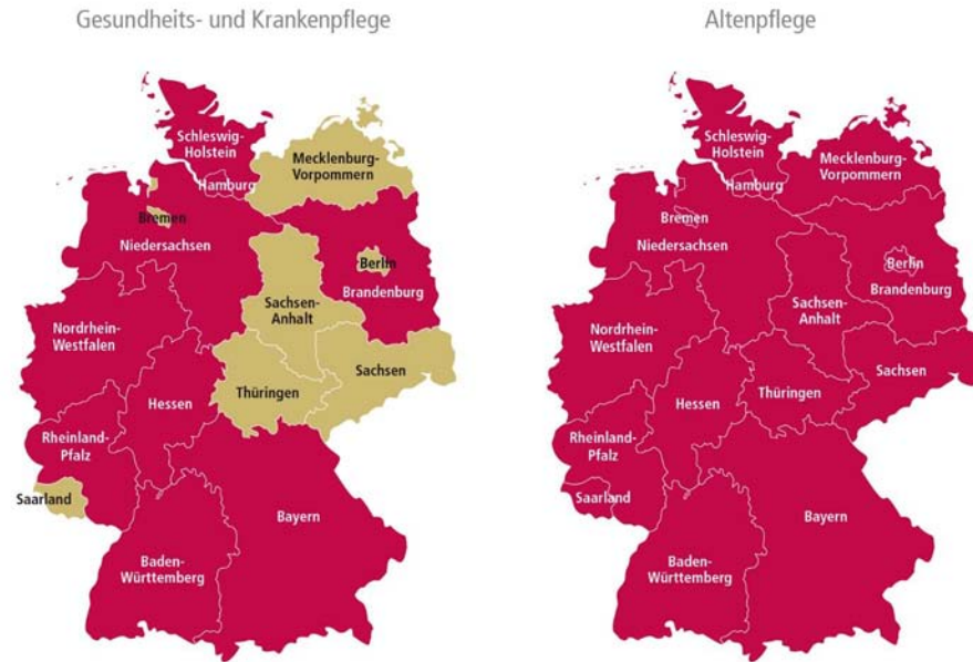
Abb. 10: Fachkräftemangel in Pflegeberufen, Dezember 2014

■ Fachkräftemangel ■ Anzeichen für Fachkräftengässe