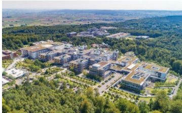
(UKGM) Universitätsklinikum Gießen und Marburg